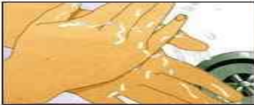
1. Palm to palm