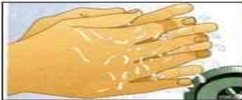
3. Interdigital spaces