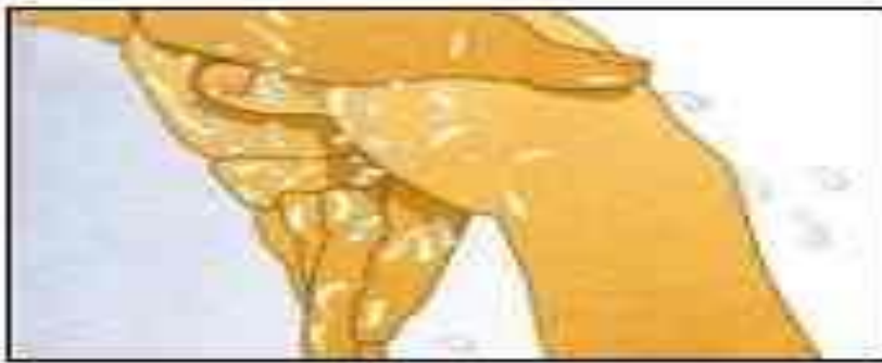
5. Thumbs and wrists